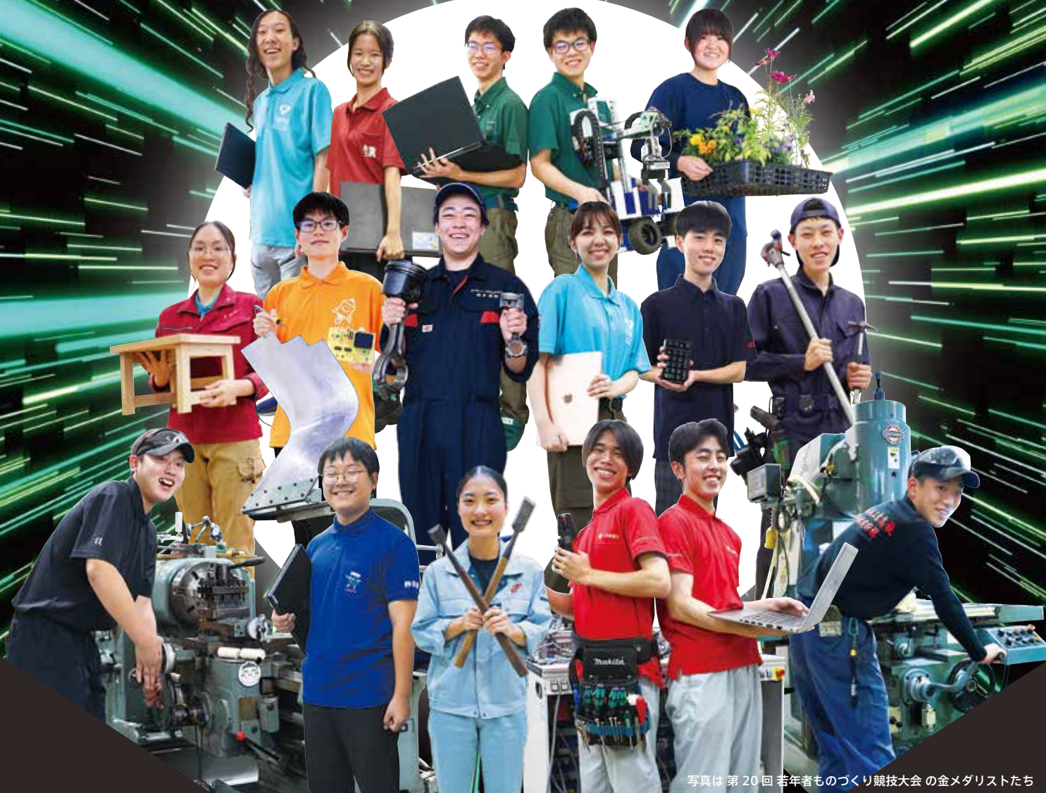
写真は 第 20 回 若年者ものづくり競技大会 の金メダリストたち