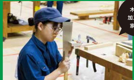
木材を加工して家具へ